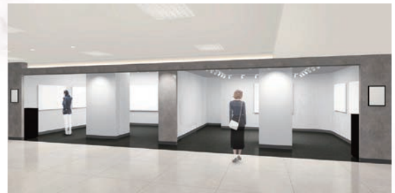
※画像はイメージで実際と異なります。